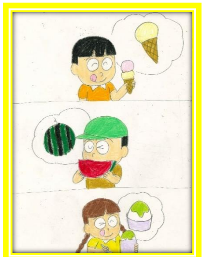
成雄のカフル漫画